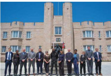
ブリティッシュヒルズの様子