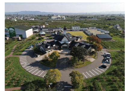
ドローンで撮影したふるさとセンター本館