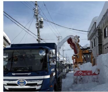
いたや町排雪作業