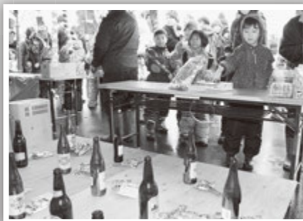
ダーツに輪投げ、子どもたちで大にぎわい 「商工会青年部OBコーナー」