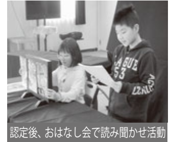
認定後、おはなし会で読み聞かせ活動