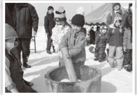
ぺったんぺったん、おいしくなあれ 「もちつき」