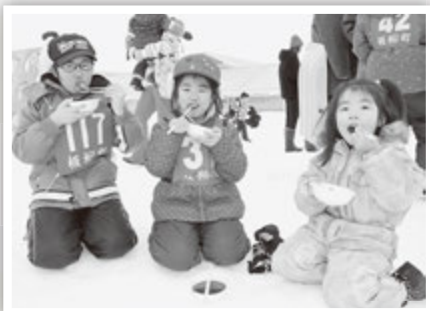
つきたてのおもちおいしい！ 「おしるこ振る舞い」