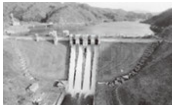
▲浅瀬石川ダム(黒石市)

ぜひ、この機会に岩木川ダム統合管理事務所Twitterにアクセスしていただき、いざという時の「備え」としてご登録をよろしく願います。