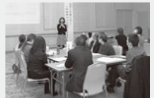
2月12日に行われた板柳町 ゲートキーパー養成講座