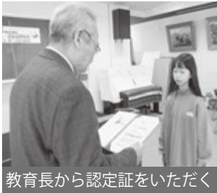
教育長から認定証をいただく