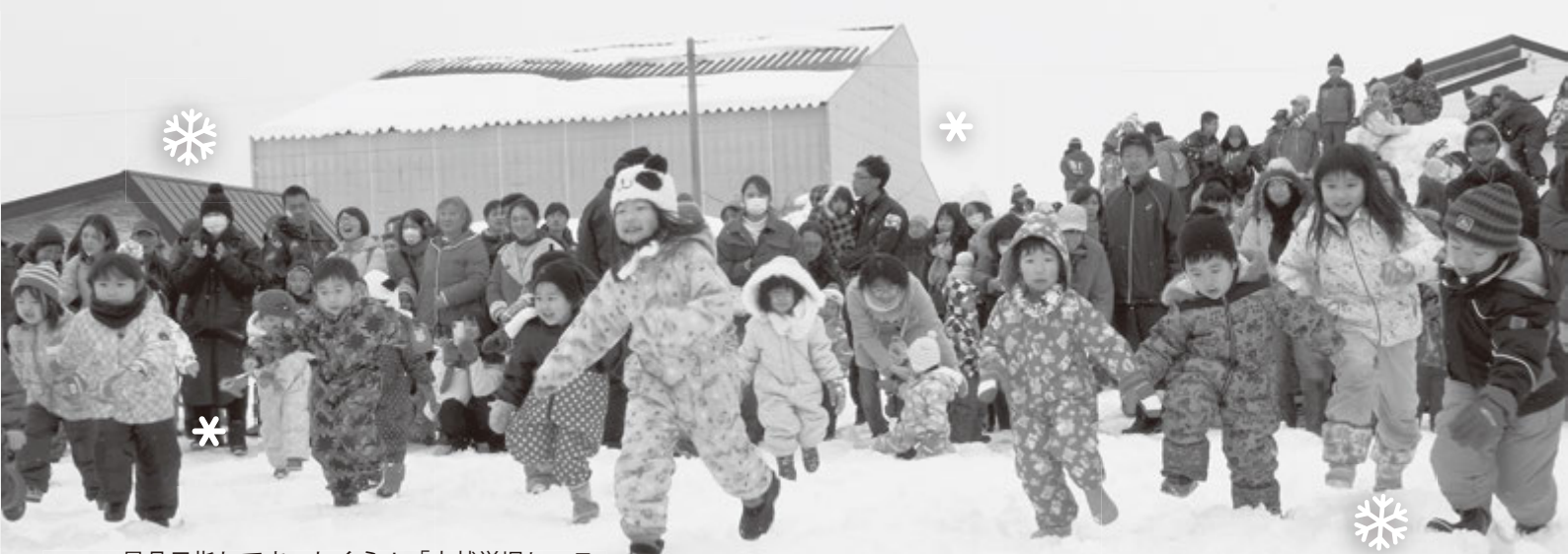
景品目指してまっしぐら！「未就学児レース」