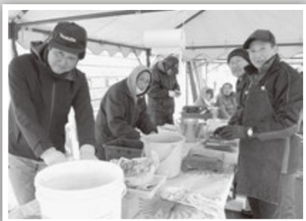
切れ味復活！ 「家庭用包丁研ぎチャリティーコーナー」