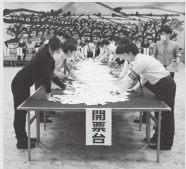
町多目的ホール「あぷる」で行われた開票

投票総数 7,212 票 有効投票 7,147 票 無効投票 65 票 無効投票率 0.90% 不受理 0 票 持ち帰り 0 票