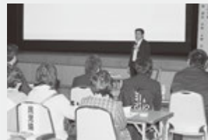
1月27日に行われた板柳町 こころの健康づくり研修会