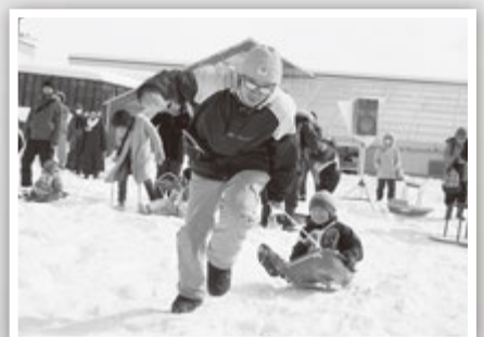
親子で協力しゴールを目指せ！ 「親子トライアル」