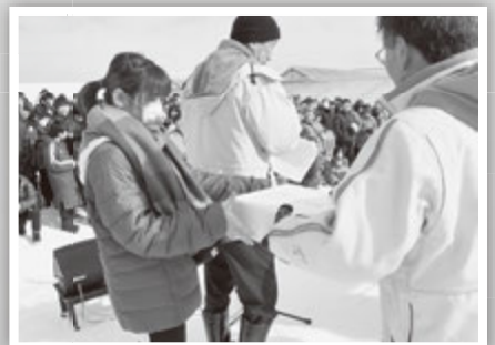
豪華賞品に大盛り上がり！ 「大抽選会」