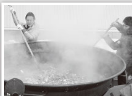
商工会青年部による豪快な調理。 大行列ができた「もつけ鍋」