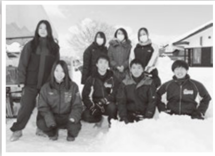
ボランティアで協力してくれた 板柳高等学校のみなさん