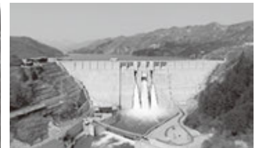
▲津軽ダム(西目屋村)