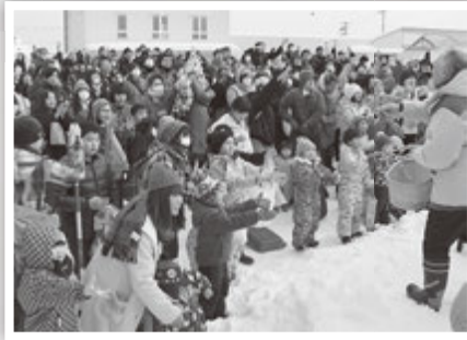
こっちにも投げて～！ 当たりクジ入りの「みかんまき」