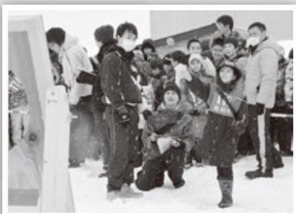
的をよ～く狙って！ 「ストラックアウト」

2月11日、毎年恒例の「りんごの里いたやなぎ雪まつり」がふるさとセンターで開かれました。今年は例年のない暖冬少雪で開催が危ぶまれましたが、なんとか雪を確保し例年どおり開催。時折雪の降る天気の中、町内外からたくさんの方が訪れ、思い思いにまつりを満喫していました。