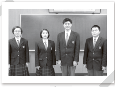
▶ 生徒会メンバーのみなさん