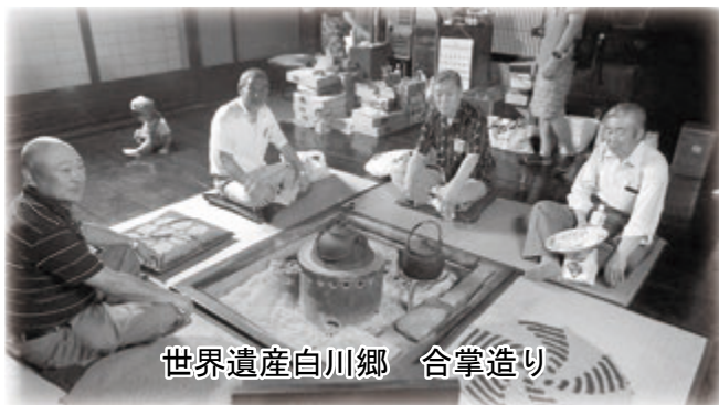
世界遺産白川郷 合掌造り

金曜日と、その翌日の土曜日にマイカー規制を実施しています。今後は、観光客のマイカーも毎日通行禁止をしようという機運が高まっているそうです。この白川郷で学んだこと、環境保全と観光振興に生かせるものと思っています。